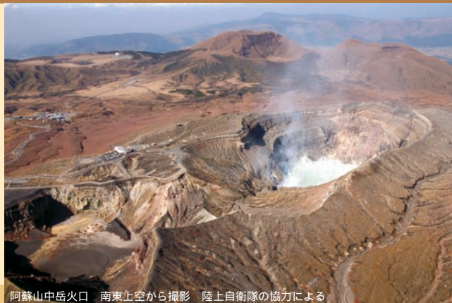
阿蘇山中岳火口 南東上空から撮影